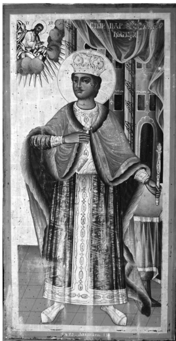
Сл. 5. Икона са наслона владаревог трона из цркве Силаска светог Духа на апостоле у Власотинцу, 1879.