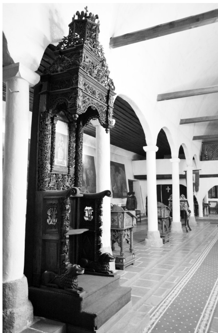
Сл. 1. Владарски трон, црква Рођења пресвете Богородице (Оцаклија) у Лесковцу, око 1882.