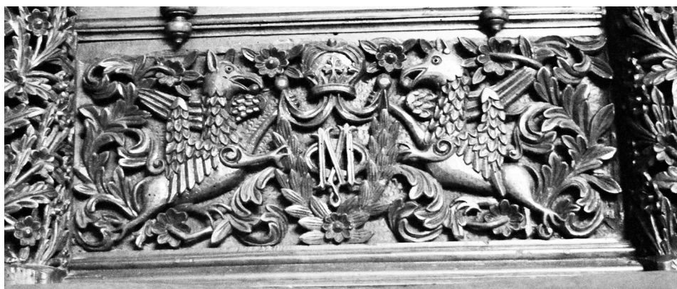
Сл. 7. Владарски трон у цркви Рођења пресвете Богородице (Оцаклија) у Лесковцу, око 1882, детаљ наслона