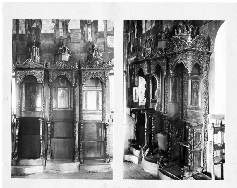
Сл. 3. Владарски тронове, црква Силаска светог Духа на апостоле у Власотинцу, око 1882.