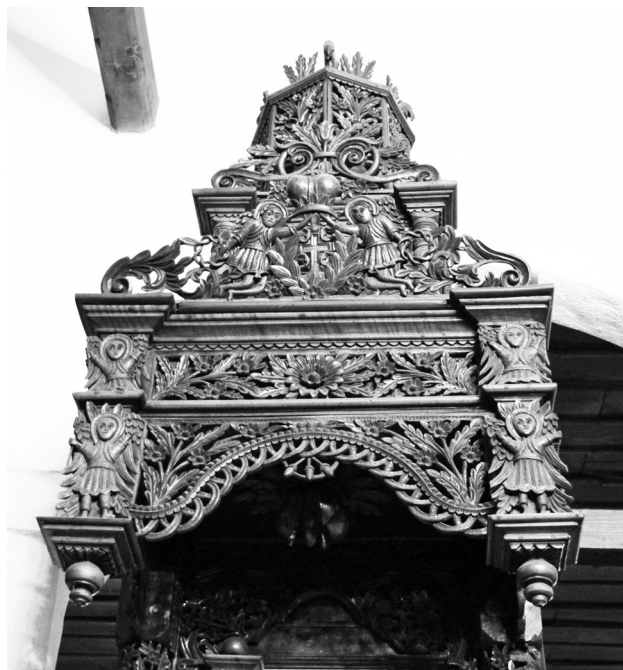
Сл. 2. Владарски трон, црква Рођења пресвете Богородице (Оцаклија) у Лесковцу, око 1882, детаљ балдахина