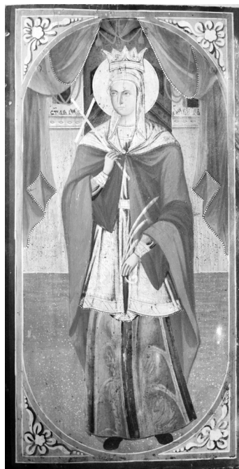
Сл. 6. Икона са наслона владаркиног трона из цркве Силаска светог Духа на апостоле у Власотинцу, око 1882.