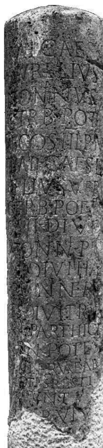
Слика 4. Миљоказ из времена Марка Аурелија 162год.