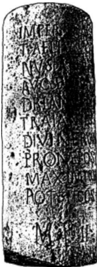
Слика 3. Миљоказ пронађен на некадашњој Градској плажи у Скопљу

Пролазећи поред тврђаве Давина Кула, код скопског села Чучер, пут је пресекао Вардар, 2 км источно од града Скупија, где је ово место обележено миљоказ пронађен у Скупију, подигнут у част цара Хадријана. Према натпису пронађеном на Злокућанима у Скопљу, на којем се колонија Скупи звала Aelius /Аелија, Вулић је закључио да је колонији дат у част цара Хадријана, јер му је рођено име Aelius . 9