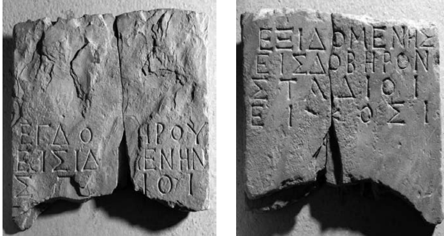
Слика 5. камени натпис из села Марвинци

В. Соколовска га је прва објавила, али се верује да је Фанула Папазоглу разоткрила право значење миљоказа. 22 На предњој страни пише: од Идомена до Добера 20 стадија. На полеђини пише: од Добера до Идомене.