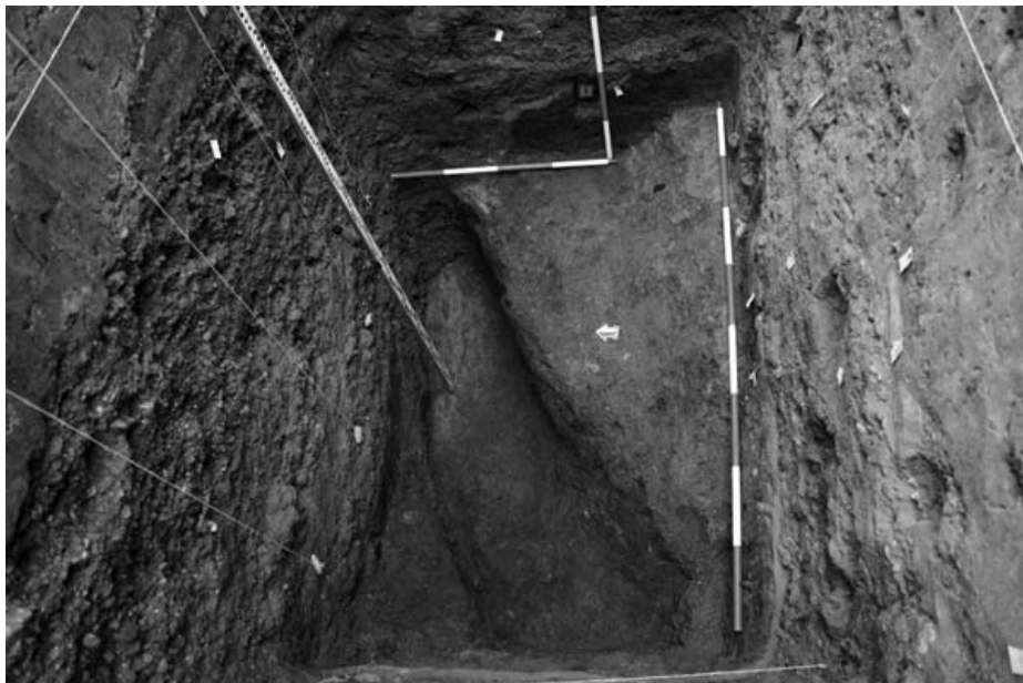
Слика 2 – Северни профил (лево), основа сонде (централни део) и јужни профил (десно) сонде XXV

северном профилу, а испод њега формиран је дебљи слој шљунка, који је садржавао неколико прослојака различитог садржаја и дебљина, а у њима је пронађена и велика количина покретног археолошког материјала. Три рушевинска хоризонта, раздвојена слојевима шљунка, видљива су у јужном профилу (Слика 3). 7