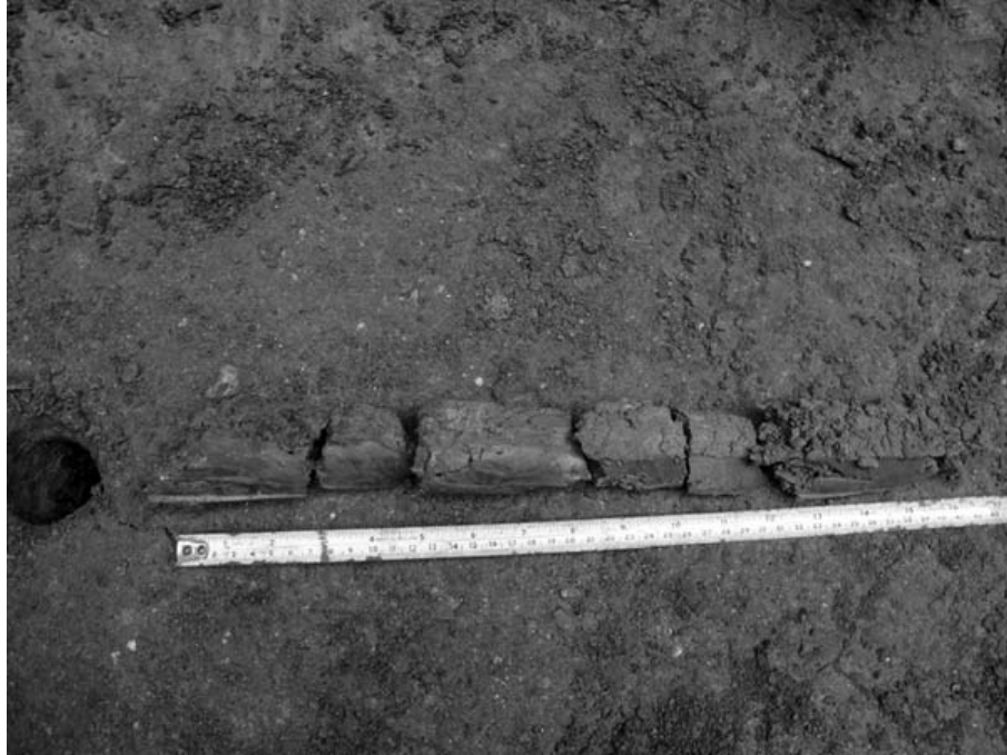
Слика 5 –Узорци бушотине 19 избушене у основи сонде XXV (непубликована документација Археолошког института у Београду)

Микроморфолошки блок узорци (приближно 14 x 10 x 8 cm) узети су вертикално, из сваког главног стратиграфског хоризонта, кроз најмање две главне фазе колувијалних процеса (колувијални депозити) и два рушевинска хоризонта. Након узорковања микроморфолошких узорака, узети су и мањи узорци земље (до 200 g) за физичко-хемијске анализе и то: рН анализе, анализе магнетног суспектибилитета и мултиелементарне анализе (атомска емисиона спектрометрија са индуктивно спрегнутом плазмом 13 ). 14