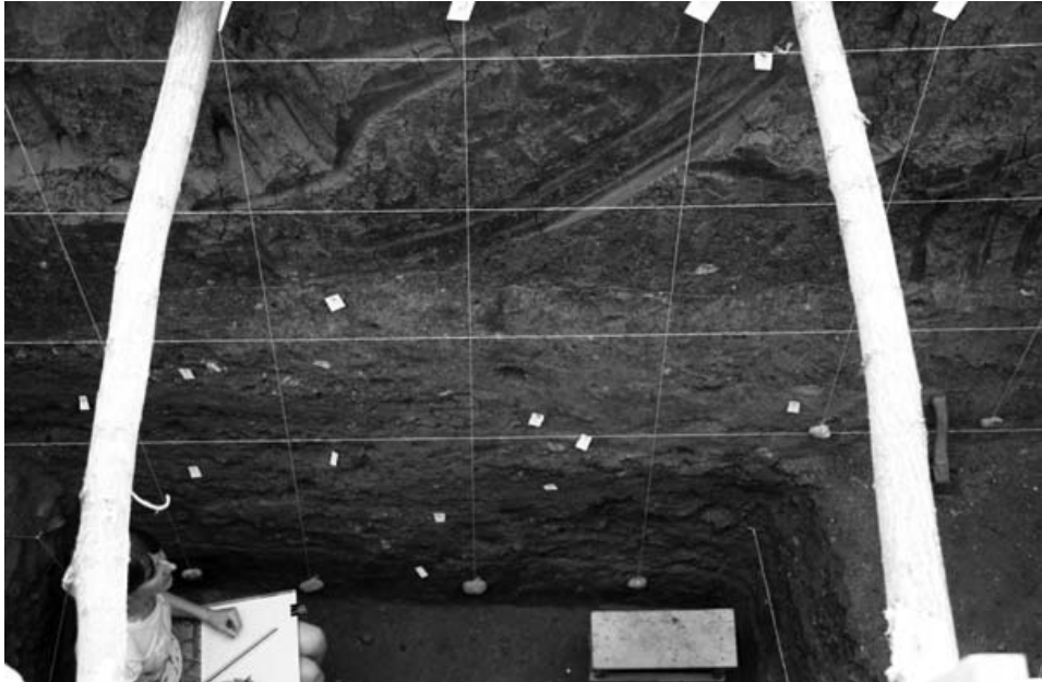
Слика 3 – Јужни профил сонде XXV

неког објекта и он је регисторован на око 2,34 m. У северном профилу сонде слој шљунка јавља се на дубини 2,36 m, док се у западном профилу могу видети два слоја. Млађи слој, на дубини од 2,14 m и дебљине 5 cm и испод њега слој дебљине 25 cm набијене светло сиве земље са лепом. 9