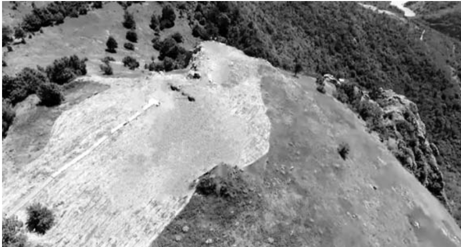
Сл. 3. Хоцин камен – брдо на којем је био смјештен средњовјековни град Прилепац

одмора, свраћали људи различитог поријекла и профила. Тако су према подацима из једне дубровачке архивалије 1424. године курири послани из Дубровника пронашли једног свог суграђанина subtus castrum Prieliapaç prope Nouam Berdam . 35 То су уједно и једини сачувани савремени писани подаци о овом граду. Будући да се Прилепац не помиње током раздобља османске власти, претпоставља се да је после османског освајања био разрушен и трајно напуштен. 36 Томе у прилог иде и данашњи површински изглед земљишта на Хоцином камену који је без видљивих бедемских остатака, али са рељефом у којем се јасно оцртавају остаци објеката. Судећи према њима, за положај утврђеног дијела Прилепца одабран је заравњени врх каменитог брда, коме је са западне стране, ка ријеци, заштиту пружала висока, готово вертикална литица. Прилаз граду је стрмим падинама био отежан и са осталих страна, с тим што је на дну оне најкраће, на истоку, ради појачања одбране, прокопан широки и дубоки ров у дужини од око 150 метара. Приликом рекогносцирања терена уочено је да се унутрашњост града састојала од два нивоа, од којих је онај површином већи на јужној страни, гдје се у рељефу уочавају и остаци двије грађевине кружног облика, био височији за око 10 до 20 метара од мањег нивоа на сјеверној страни. 37