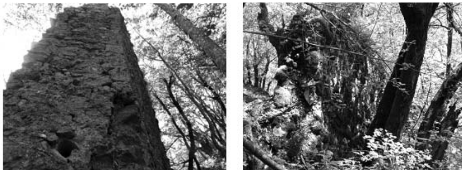
Сл. 1 и 2. Остаци главне куле и бедема средњовековног града на десној обали Бистрице/Горња Кута